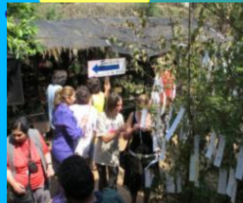
El 31 de marzo, día de la clausura de Amigos Árboles, se colgaron en los árboles del jardín los papeles Tanzaku escritos durante la acción.

Amigos Arboles se clausuró junto con el aniversario del Jardín de las Epífitas. Dentro de las actividades de ese día se llevó a cabo una exposición de bonsái y orquídeas, se colgaron en los árboles del jardín los papeles Tanzaku escritos durante la acción, y se realizó otra presentación del libro “Amigos árboles”.