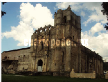
Tepeatlán ha sido sede dos años de este tipo de programas. * David Morales. CP

Agregó que cada proyecto de voluntariado es de nivel internacional debido a que participan jóvenes de todas las nacionalidades y de diferentes culturas que proporcionan conocimiento para el desarrollo de una comunidad en las áreas educativas, sanitarias, ambientales y culturales. Además, el espacio sede tendrá una proyección turística internacional, pues una vez concluido el campamento cada participante comunica su experiencia en su país natal, de tal forma que la comunidad deja de ser desconocida. La reunión tendrá lugar en el Centro de Desarrollo Comunitario (Cedeco) "La Albarrada".